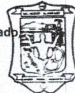
MUNICIPIO DE SALVADOR ALVARADO

Por lo tanto mando se imprime, publique, circule y se le dé el debido cumplimiento. Es dado en el edificio sede del H. Ayuntamiento de Salvador Alvarado, Sinaloa, a los 16 días del mes de mayo del año 2023.